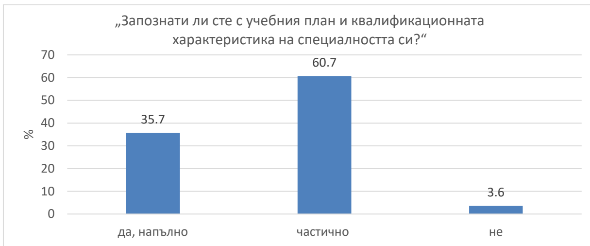
Фиг. 1 Отговори на въпроса „Запознати ли сте с учебния план и квалификационната характеристика на специалността си?“

От фигурата се вижда, че почти всички студенти заявяват, че са запознати с учебния план и квалификационната характеристика на специалността си – 35,7% „да, напълно“ и 60,7% „частично“. В сравнение с миналата година се забелязва повишаване на процента на отговорилите с „частично“ (51,0% през 2022 г.). Само 3,6 % не са се запознали предварително с учебния план и квалификационната характеристика на специалността, но е видно, че голяма част от кандидат студентите имат предварителна информация за специалността за която кандидатстват.